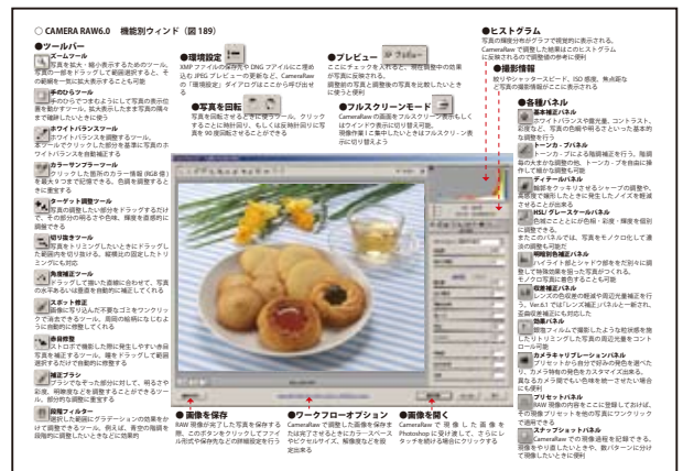
テキストで使われた詳細な CameraRAW の機能一覧の解説ページ