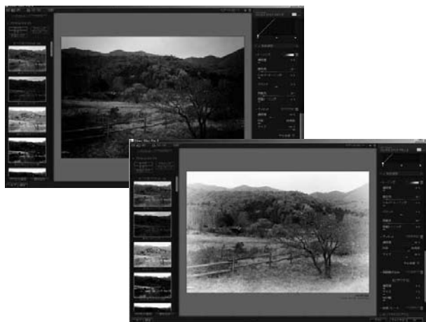
ビネットや周囲焼込などのエフェクト効果も自在