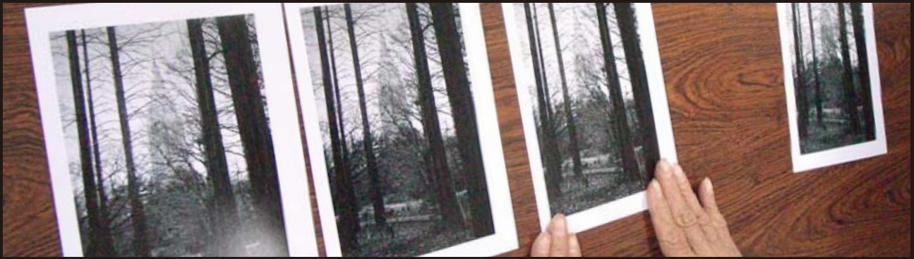
安藤和会員によるプリントの明部再現の比較研究

Digitable 基礎講座「CAMERA RAW による RAW 画像処理」：高木大輔講師